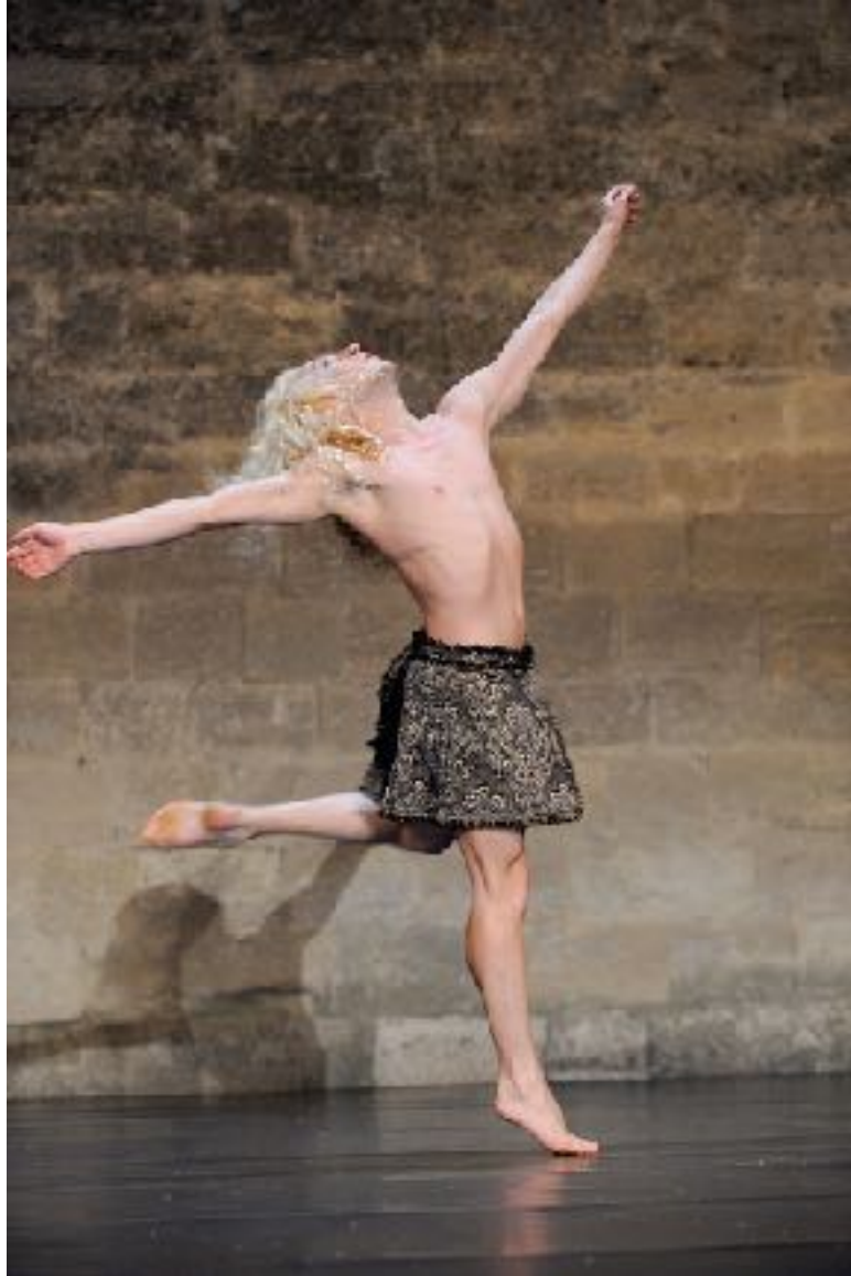
François Chaignaud Festival d'Uzès 2010